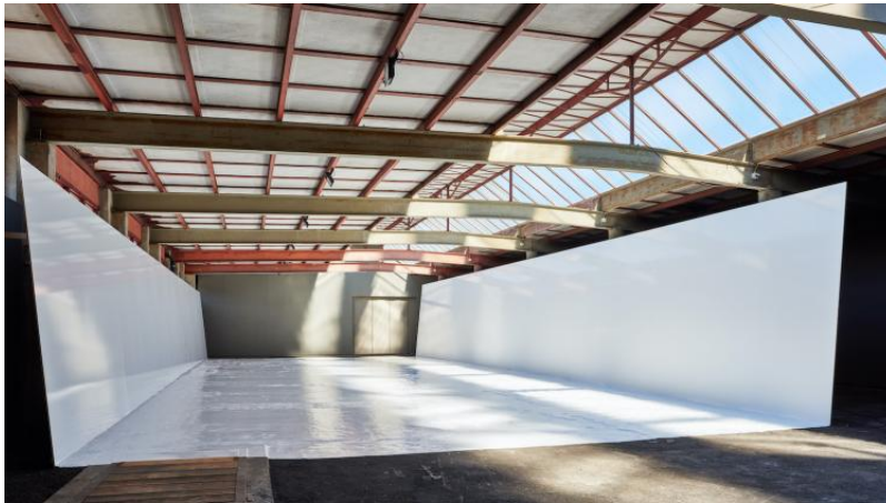
Blendend weisse Weite: Das ist die Ausgangssituation in Reto Bollers Ausstellung in der Kunsthalle Arbon.

Zufällig und eigensinnig und doch alles am richtigen Platz: Reto Bollers Ausstellung in der Kunsthalle Arbon ist fast schon verstörend lebendig. (Lesedauer: ca. 3 Minuten)